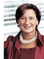
Landesrätin Mag. Johanna Mikl-Leitner